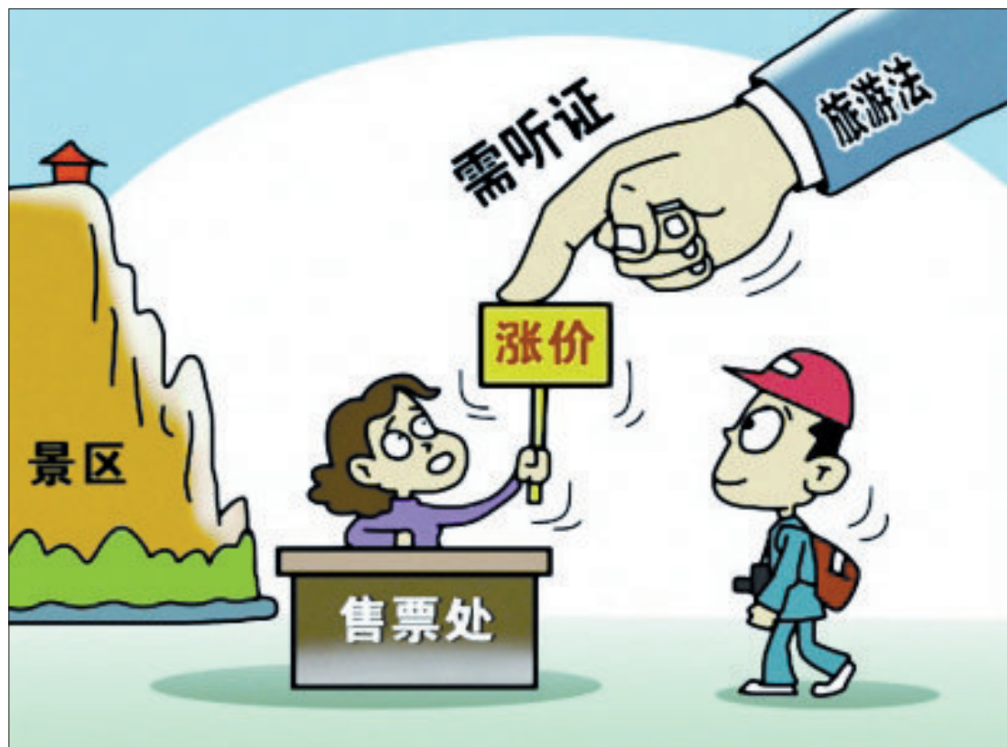
《旅游法》规定,景区拟收费或者提高价格,应举行听证会(资料图片)

《中华人民共和国旅游法》将于10月1日起正式实施,全国学习贯彻该法的电视电话会议已于近日召开。作为我国首部《旅游法》,它对保障旅游者合法权益、限制旅游景区涨价、杜绝“零负团费”、规范导游行为等做出规定。市旅游发展委员会负责人表示,《旅游法》的实施将为未来我市旅游的开发、服务和市场监管提供重要的法律保障。