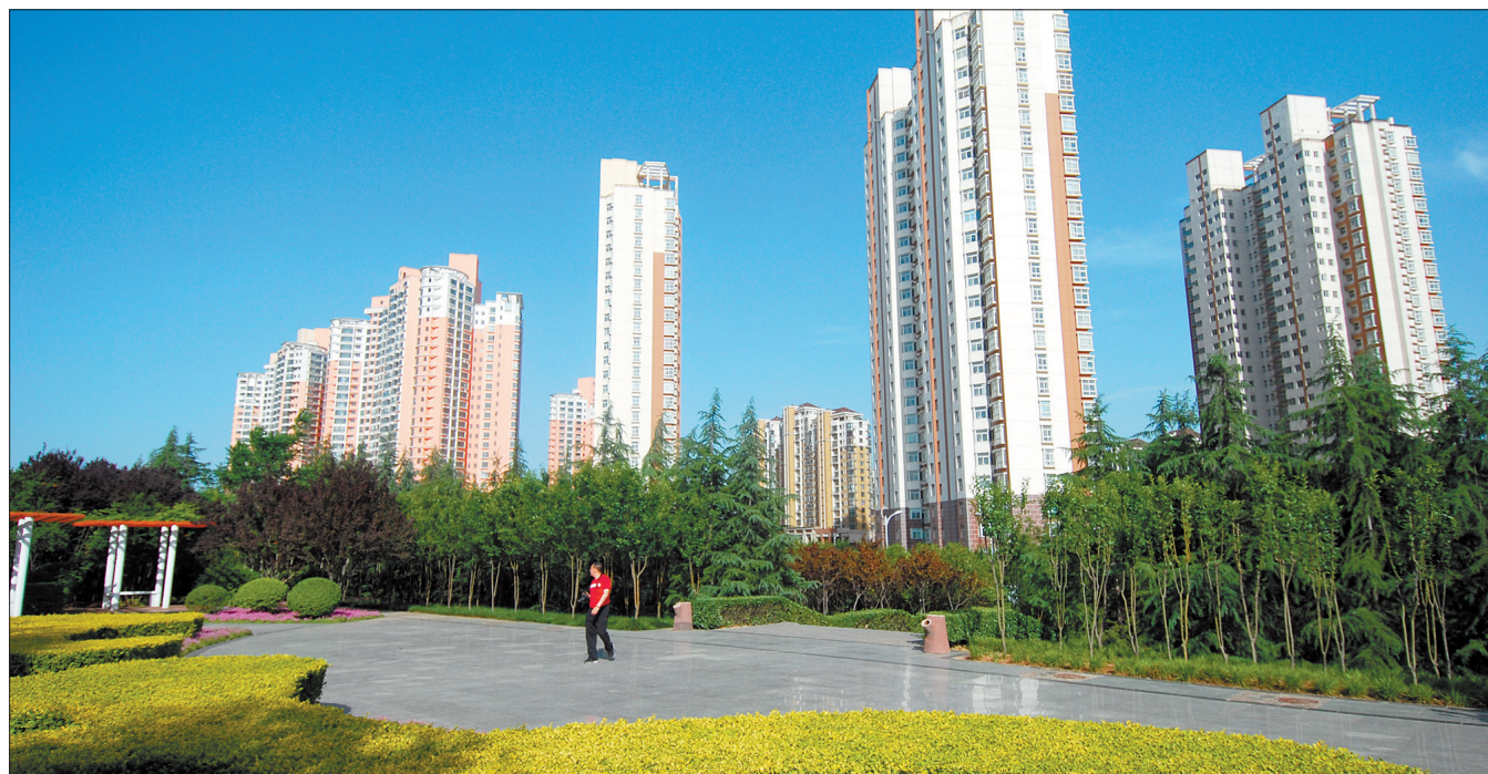
新区环境美化，风光旖旎

家属院。以前，大量的流动商贩在家属院门口摆摊设点、占道经营，王大妈每天进出不仅要绕道，还要闻各种怪味道，别提多难受了。经过深入调查，区城市管理局画线、定位，使占道经营的流动商贩初步达到了统一摊点设置、统一经营时段、统一卫生保洁的管理要求。如今，经过各部门疏堵结合的整治，该小区的卫生有专人清扫了，乱摆摊的现象没有了，连道路也变得更宽阔了，王大妈觉得住在这里很舒服。