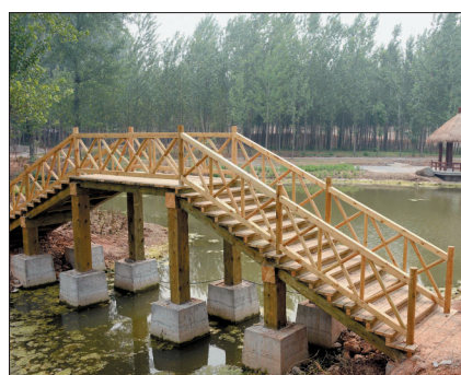
湿地公园基础设施日渐完备

林木茂密、芳草萋萋、曲径通幽……昨日, 记者在龙门国家湿地公园内看到, 总投资约15亿元的公园一期工程已初具规模, 将于近期向游人开放。