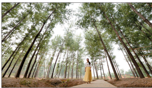
湿地上茂密的树林