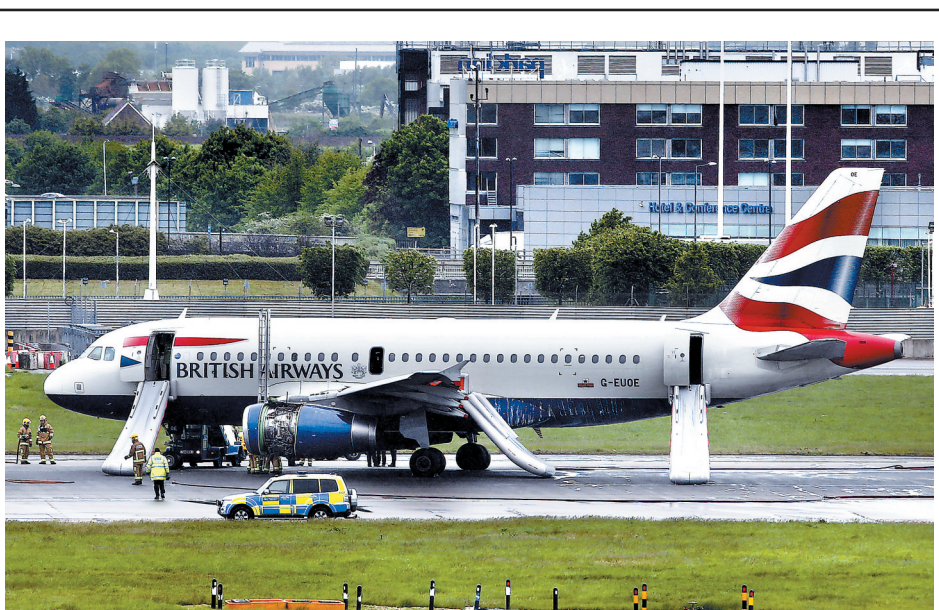
5月24日,在英国伦敦希斯罗机场,工作人员在检查迫降的客机