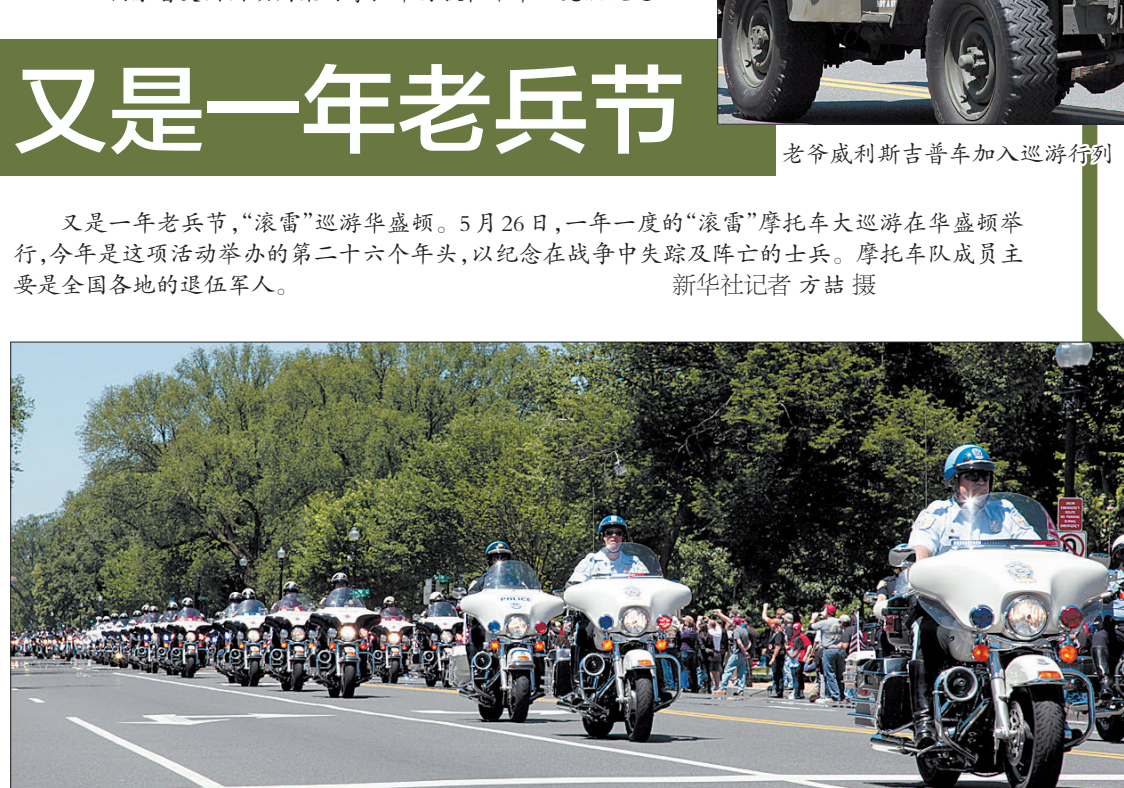
由摩托骑警组成的车队在“滚雷”巡游摩托车队开道