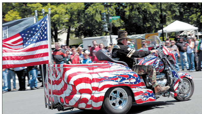
一辆涂着美国国旗图案的摩托车行驶在市中心宪法大道上