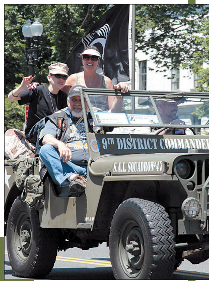
老爷威利斯吉普车加入巡游行列