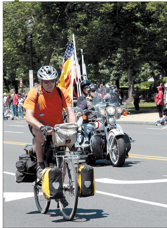
一名自行车手加入巡游行列