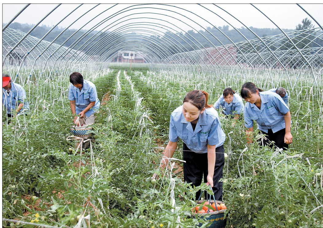
通过全民创业带动建起来的磁涧镇绿博园采摘园一角

今年,新安县结合发展实际,对全民创业的目标和重点进行了调整,确立了新增500家民营企业的目标,将全民创业的重点调整为:一产打造生态农业亮点,培育特色产业群;二产促转型升级,提升县域经济综合竞争力;三产以餐饮、旅游、商贸、物流等产业为抓手,打造精品服务业。同时,新安县不断加大全民创业的扶持力度,将全民创业的保障措施由去年的24条调整为今年的30条,将“降低创业门槛、壮大龙头企业、加大贴息力度”等纳入到保障措施之中,营造新安县良好的创业氛围。