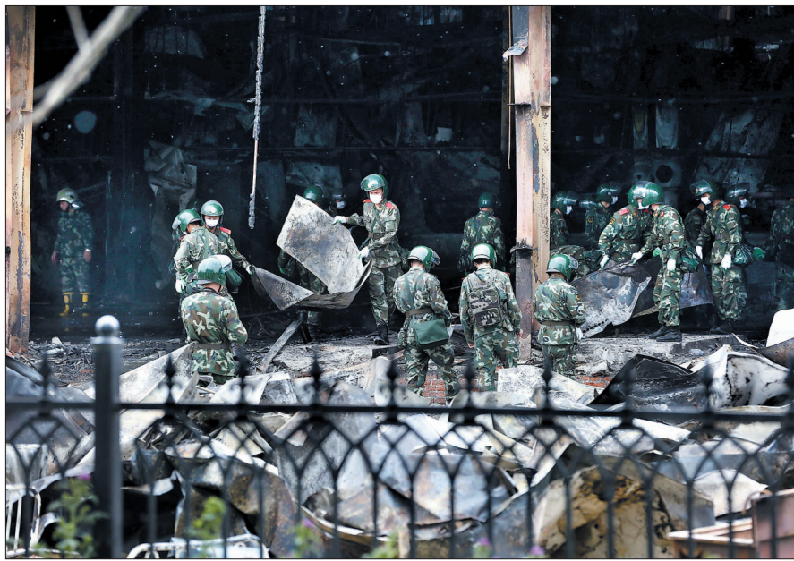
6月4日,武警官兵在清理火灾事故现场