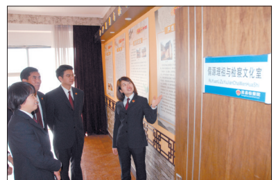
检察机关干部参观检察文化室(资料图片)