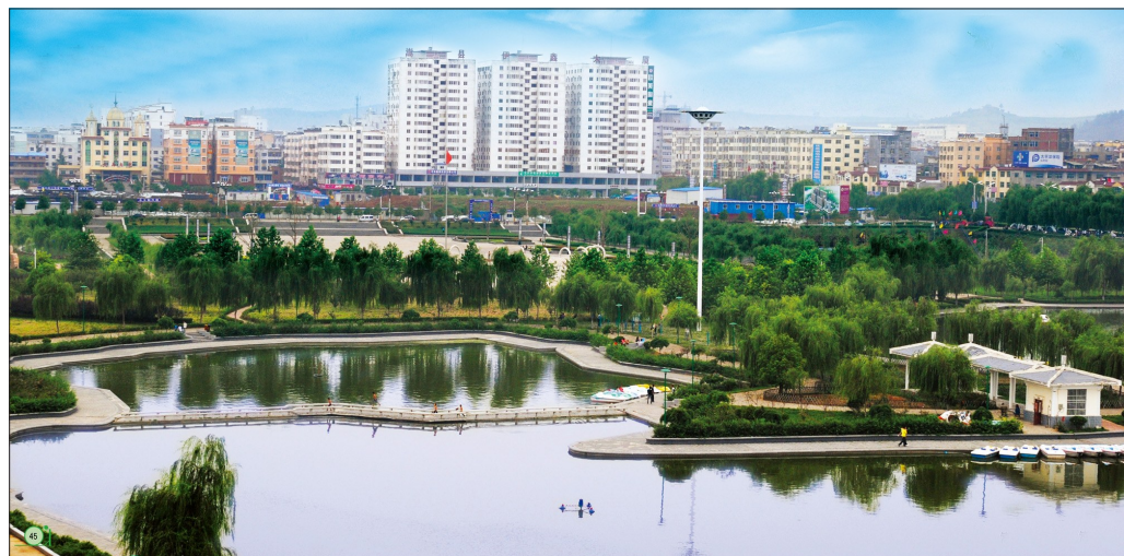
绿色嵩县(资料图片)

自去年以来,嵩县秉承“5A嵩县”建设理念,按照“生态立县、文化兴嵩、全域规划、城乡一体”的发展思路,把全县当作一个5A级景区来规划、建设、管理和营销,按照“一乡一品、一乡一色”来规划,以丰富的生态资源为优势,坚持生态保护优先,适度开发生态旅游,建设旅游特色小镇,打造了一大批原生态的自然景区。这些遍布嵩县城乡的乡村生态旅游景区丰富了旅游业态,扩大了旅游版图,使嵩县处处有美景,吸引了更多游客。