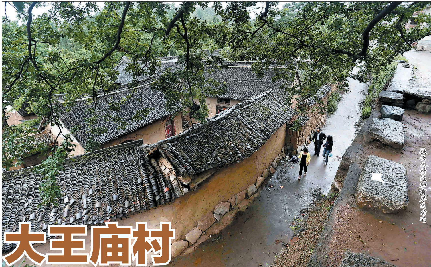
狭长的村道和有层的老宅