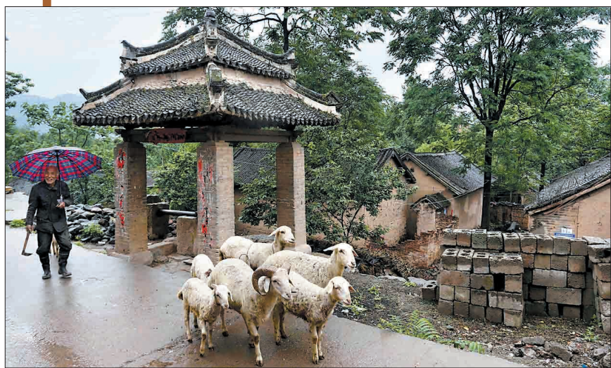
放羊的老人和古老的井楼