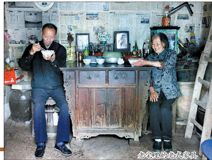
老宅里的老式家具