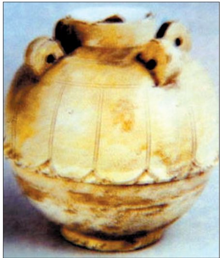
青瓷莲花纹罐(北魏洛阳茶具) 大兵瓶