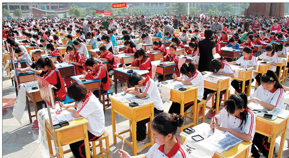
千人书法大赛

目前,新安已形成以文化中心为龙头,以乡镇文化站、村级文化大院为骨架,以文化广场和特色文化基地为脉络的多层次、多体制、上下贯通、相互联动的公共文化服务网络。