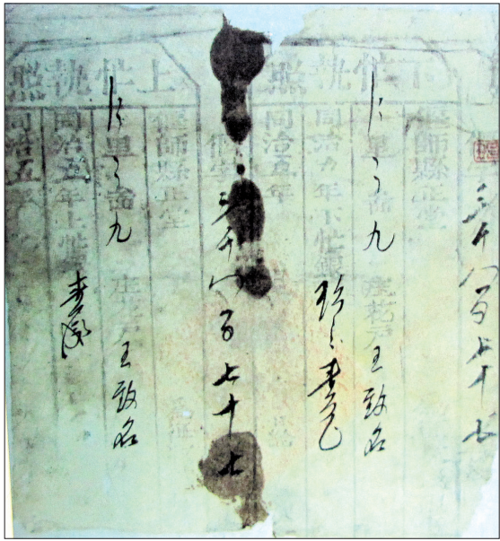
偃师王致君清同治五年上、下忙执照

核心提示 执照文书是旧时官府发给老百姓，证明其赋税缴纳完毕的文字凭证。近年来，洛阳民俗博物馆征集到各类执照文书91份。从文字上看，这些执照文书用语规范严肃，所载赋税的增减在一定程度上反映了当时社会的动荡与变革。