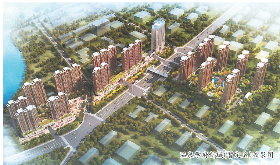
温泉学府新城(暂定名)效果图

吴运久介绍,该项目预计投资18亿元,一期工程将于今年年底开工,整个项目在6年之内完工。(李玉星)