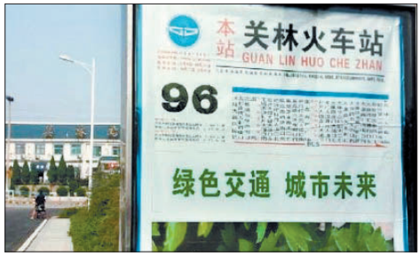
96路公交车关林火车站站牌(资料图片)

本报讯(记者 赵佳)日前从市公交集团公司获悉,在我市刚刚开通的96路公交车中,将有部分车辆运营线路延长至关林火车站前广场附近,这也是我市首条直达关林站的公交线路。