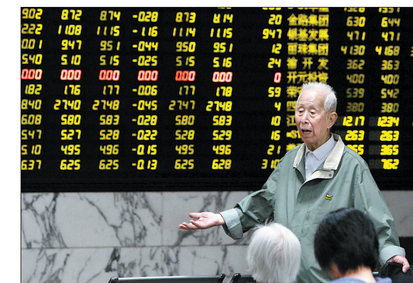
昨日,一名股民在上海一家证券营业部的大屏幕前难掩失望之情

中央汇金投资有限责任公司20日发布公告称,汇金公司近日已在二级市场增持中国工商银行、中国农业银行、中国银行、中国建设银行、中国光大银行、新华人寿保险公司的A股股份,并将在未来六个月继续增持。