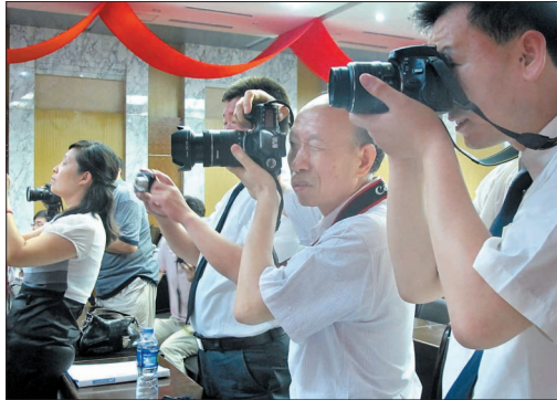
瞧,社区助理记者“长枪短炮”,多专业

市委常委、宣传部部长杨炳旭在社区助理记者培训班毕业典礼上表示,本次《洛阳晚报》社区助理记者招募活动,是一次“从群众中来,到群众中去”的良好实践,很好地贯彻了近期党中央号召开展的党的群众路线教育实践活动精神。希望社区助理记者们多关注基层和弱势群体,反映民生、民态、民意,替老百姓讲真话,为老百姓办实事。