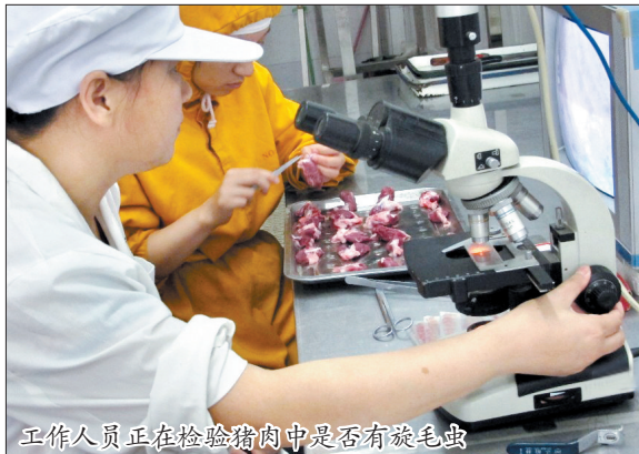
工作人员正在检验猪肉中是否有旋毛虫

本周是我市的“食品安全宣传周”。22日,市商务局、市畜牧局等单位组织市民代表到我市生猪定点屠宰厂——洛阳正大食品有限公司,参观从生猪进厂到猪肉出厂的全过程。