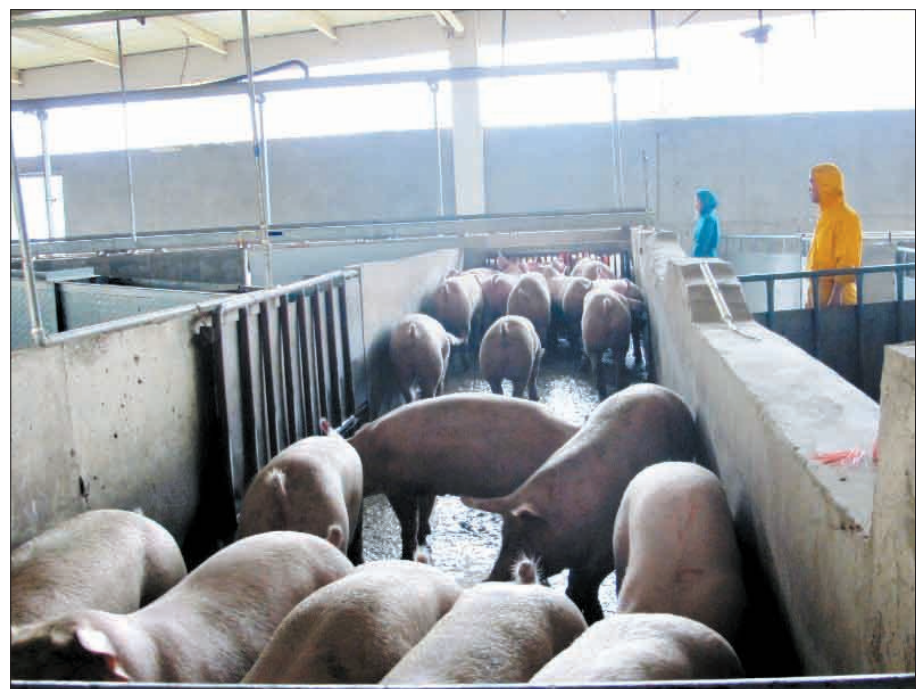
生猪在待宰车间等候进入宰杀车间