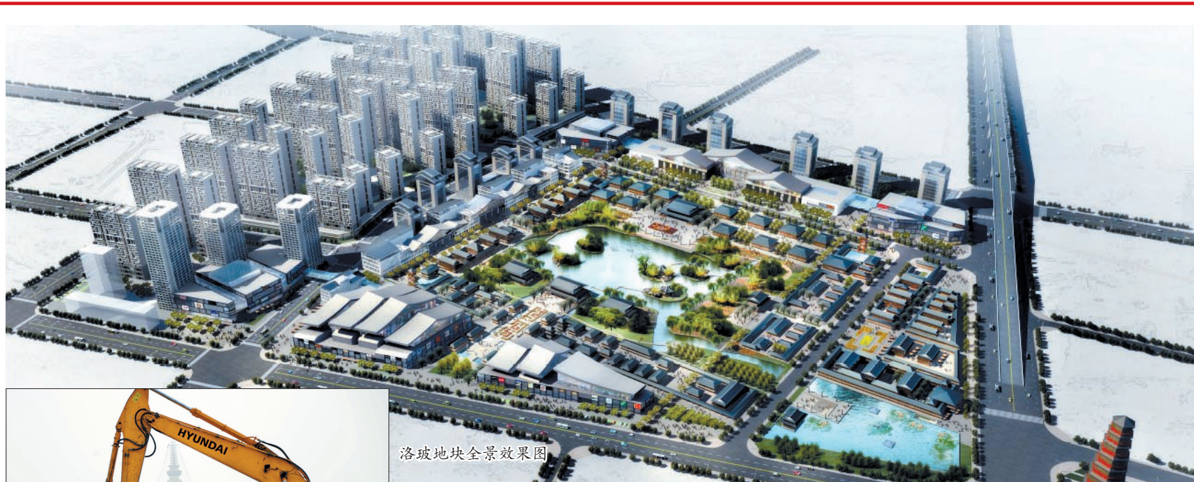
洛玻地块全景效果图

昨日上午,考核组在听取我市2012年度扶贫开发工作汇报后,赴栾川县、洛宁县等地走访考核。