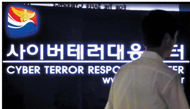
6月25日,一名工作人员在韩国首尔警察厅下属的网络黑客应对中心忙碌着