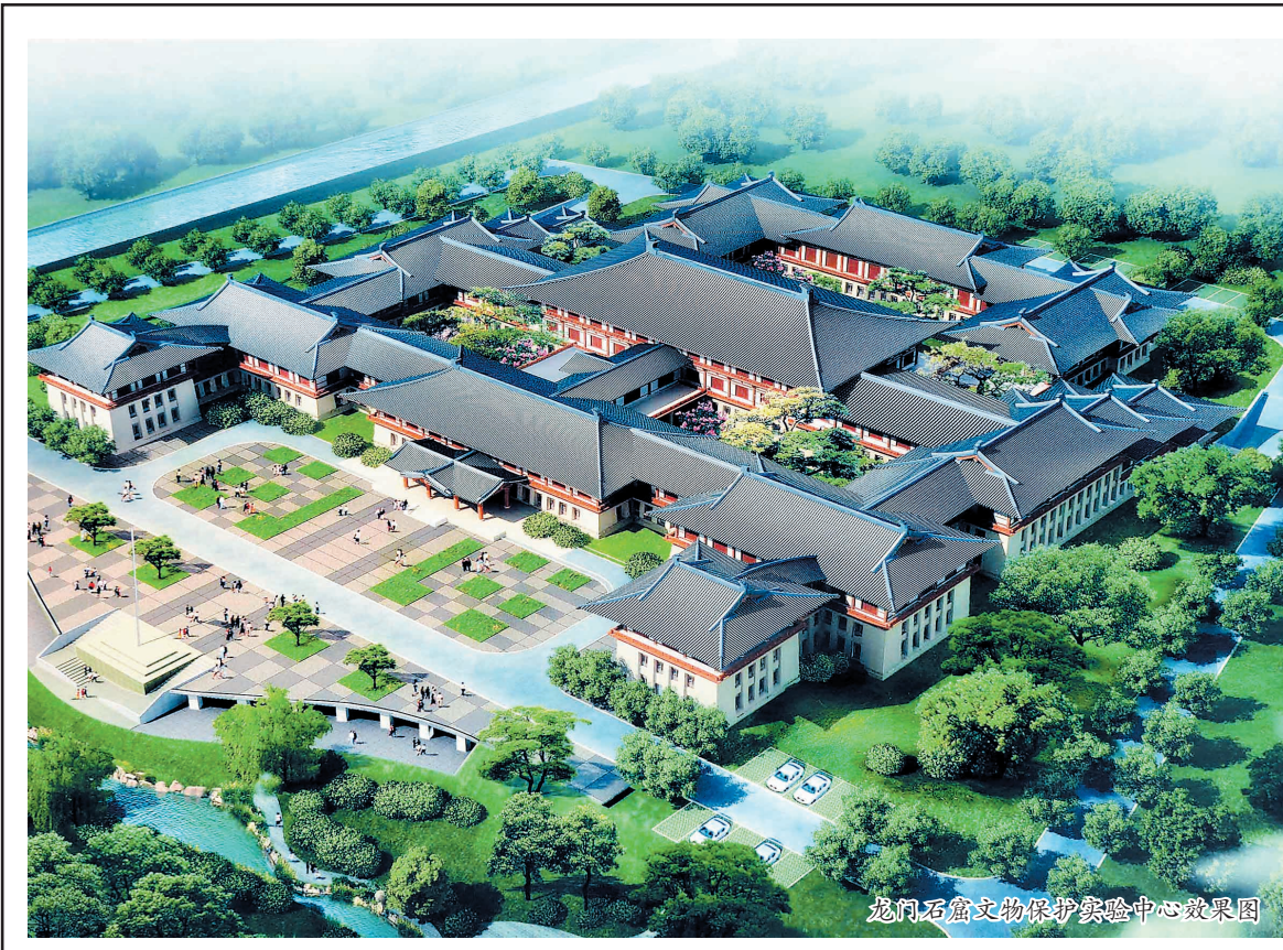
龙门石窟文物保护实验中心效果图