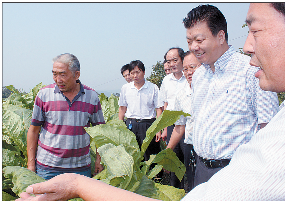
县领导到城关镇桐树凹村调研产业结构调整情况

同群体设置调查问卷,按照每个后进村平均不少于20个调查对象的标准进行问卷调查,重点了解群众对党组织工作满意与否、“三务”公开情况、惠民实事办理情况等内容的意见。