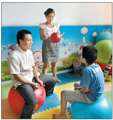
夫妇俩给学员上课