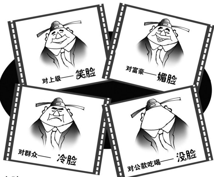
变脸 新华社发 赵乃育作

众满意没用。“有时也心寒,群众称赞的干部未必能提拔,将上面的领导服务好了,你的进步会加快。”