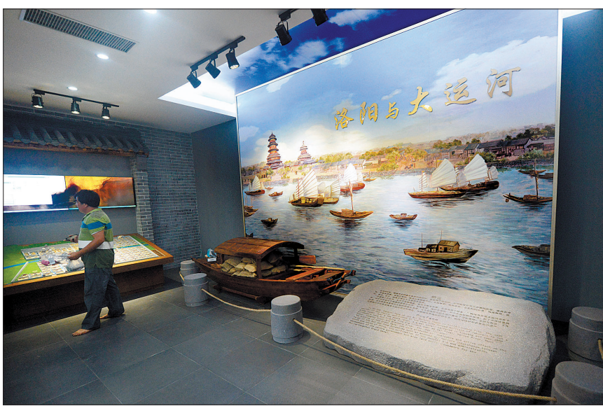
《洛阳与大运河》展

据了解,山陕会馆自1996年正式收归市文物部门管理后,就一直处于保护、维修状态。2004年8月至11月,我国政府和意大利政府联合组织的中意合作古建筑学习班