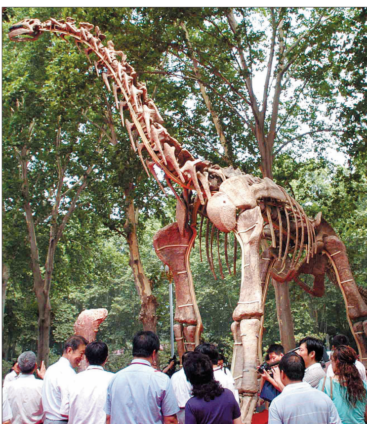
复原的汝阳黄河巨龙骨骼

河南省地质博物馆馆长蒲含勇介绍,我国长脖子恐龙以“四川马门溪龙”为代表,后又在新疆发现马门溪龙类恐龙,脖子长16米,但这些长脖子恐龙均发现于侏罗纪地层中。此前发现于甘肃的康熙湾龙、蒙古国的艾氏长生天龙也属于早白垩纪晚期,汝阳云梦龙可能与之组成一个亚洲早白垩纪晚期具有长脖子的蜥脚类恐龙类群,该类群比巨龙类原始而比发现于山东省的师氏盘足龙进步,师氏盘足龙可能为其原始类群。这一研究成果最近发表在英国学术期刊《白垩纪研究》第44卷上。 由于这个恐龙化石发现地——花庙沟村属于汝阳县云梦山地区,特命名为汝阳云梦龙。截至目前,在汝阳盆地早白垩纪晚期的地层中,已发现了4种蜥脚类恐龙:汝阳黄河巨龙、岷山龙、巨型汝阳龙和汝阳云梦龙。