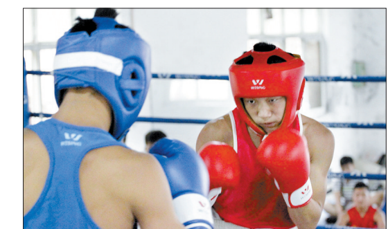
拳击选手激烈对抗

本报讯(记者 张锐鑫 实习生 王鹏飞 通讯员 刘杰)经过两天的激烈较量,市十二运会拳击比赛昨日鸣金。宜阳县队以10枚金牌的成绩成为该项目的大赢家。