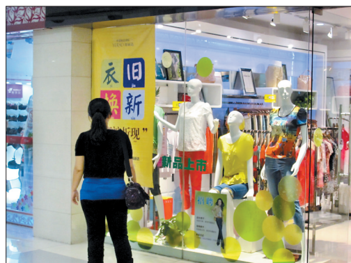
某商家开展“以旧换新”促销

眼下正值夏装打折季,部分商家将家电市场中惯用的促销方式——“以旧换新”,引入服装销售中。