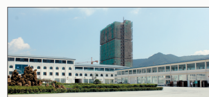
已建成的安方仓储物流中心