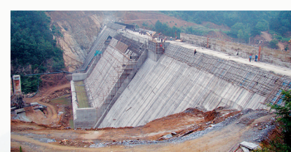
第四水源大坝基本建成