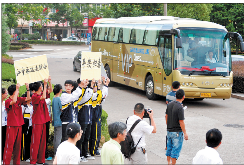
7月14日,一辆载着31名江山中学师生的大巴驶入浙江江山中学的校门,大批学生、老师和家长在校门口迎接他们回家