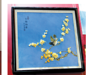
铜奖作品《中国梦之白梅栖禽》