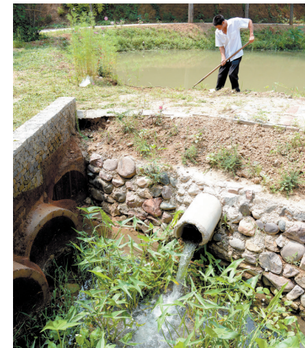
微型人工湿地处理村民生活污水

昨日,在伊川县城关镇瓦西村边卧龙沟里,清澈的溪水碧波荡漾,成群的鱼儿在小溪里畅游,竹林里不时传出村民欢乐的笑声。然而,谁会相信几年前,这里还是一条臭气熏天的“龙须沟”。