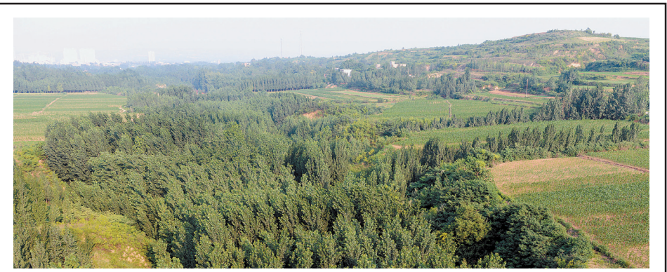
沟里树木郁郁葱葱