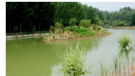
小水库既可蓄水也可浇地