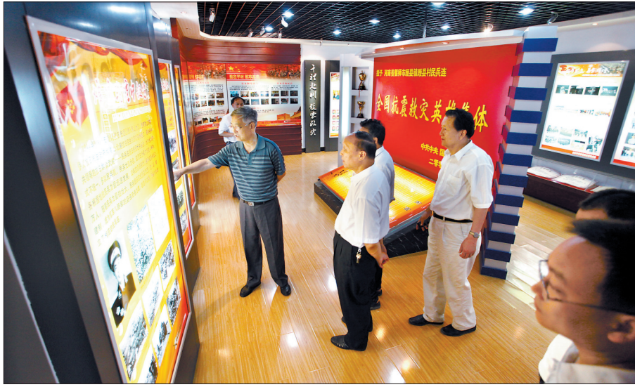
偃师市顾县镇民兵连历史文化展示室

近日,偃师市和洛宁县多个乡村革命历史展示室建成开馆。我市此类展示室因宣传保护当地革命历史、传递社会正能量广受好评,但由于受众面较窄,常出现“叫好不叫座”的尴尬情形。业内人士建议,可通过丰富体验内容、拓宽投资渠道等手段,挖掘乡村革命历史展示室的红色旅游资源。