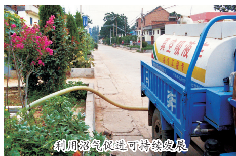
利用沼气促进可持续发展