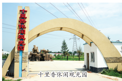
十里香休闲观光园