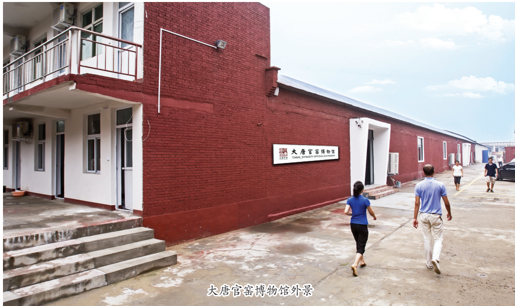
大唐官窑博物馆外景

陶瓷,是中华民族最伟大的发明创造之一,也是人类社会从蒙昧走向文明的重要起点与标志。大唐官窑白瓷艺术,就是源远流长的人类陶瓷文明史上一颗璀璨灿烂的明珠。 陶是瓷的祖先,瓷是陶的后裔,同根同源,一脉相承。史料记载,距今八九千年前,中华先民就用勤劳和智慧发明了原始陶器,从此拉开了以陶为主要表现形态的中国陶文化序幕,并孕育诞生了仰韶文化、龙山文化、马家窑文化、河姆渡文化和洛阳二里头文化。随着生产力的进步,原始瓷从原始陶中脱颖而出。随着考古研究,夏商时期洛阳二里头文化遗址出土的白陶酒器和洛阳北窑西周墓出土的原始青瓷,为瓷器的产生奠定了基础。东汉时期,高温青瓷烧制技术应运而生。至北魏,雄才大略的孝文帝迁都洛阳,洛京窑、登封窑相继诞生,高温青瓷日臻成熟,高温白瓷凤凰涅槃。汉魏青瓷与白瓷也成为中国陶瓷发展史上的里程碑。