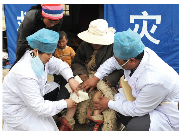
2010年青海玉树大地震,该校医疗援助队参与抗震救灾