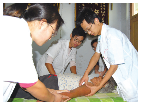
手法正骨是平乐郭氏正骨的特色