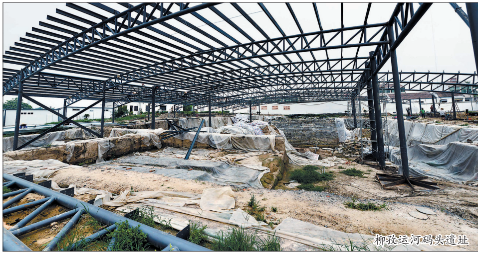
柳孜运河码头遗址