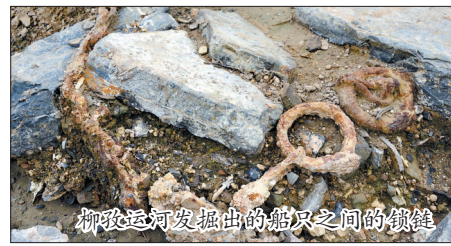
柳孜运河发掘出的石块之间的铁箍

离开商丘市,顺着公路一路向东南,采访团来到了安徽省西北部的工业城市淮北市。十几年前,在淮北市一个名叫柳孜的小村子发现的隋唐大运河码头遗址轰动一时,在大运河考古史上写下了浓墨重彩的一笔。