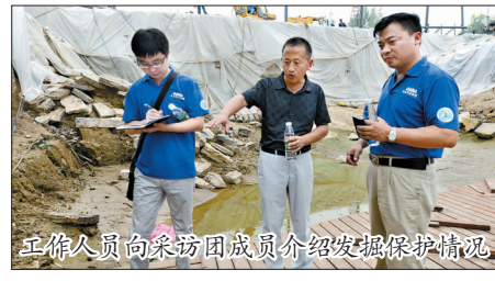
工作人员向采访团成员介绍发掘保护情况