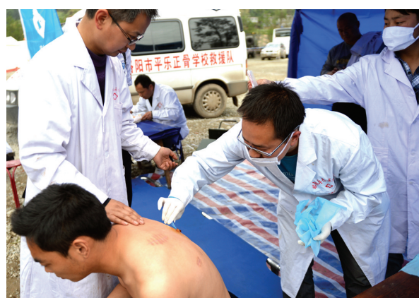
2013年芦山大地震,该校医疗援助队参与抗震救灾