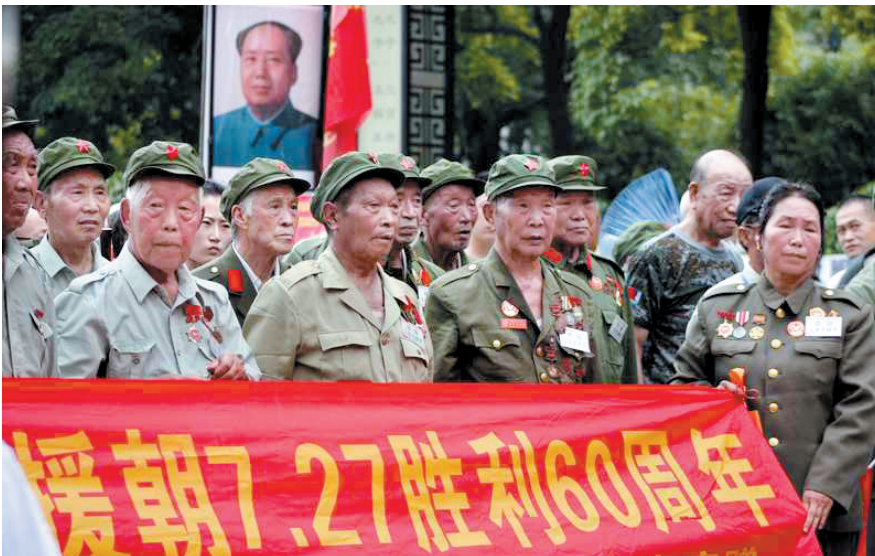
老兵方阵 cccx47 摄于周王城广场

本版联系方式:65233629 电子信箱:lydaily618@163.com 选稿基地:洛阳网·河洛文苑 选图基地:河图网 洛阳网·摄影天地