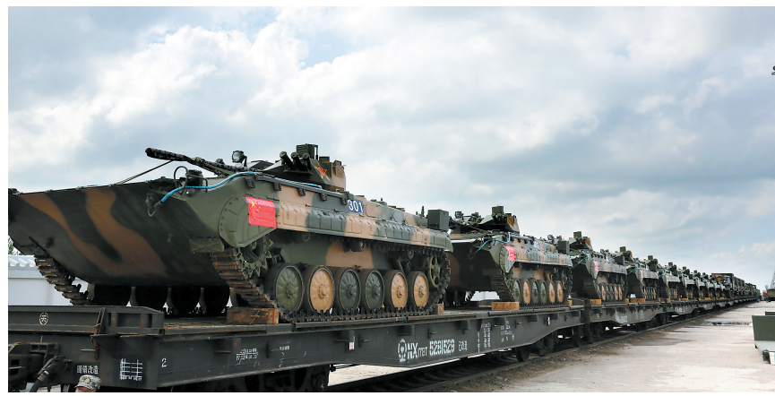
7月25日,中方参演部队部分武器装备装车完毕,整装待发