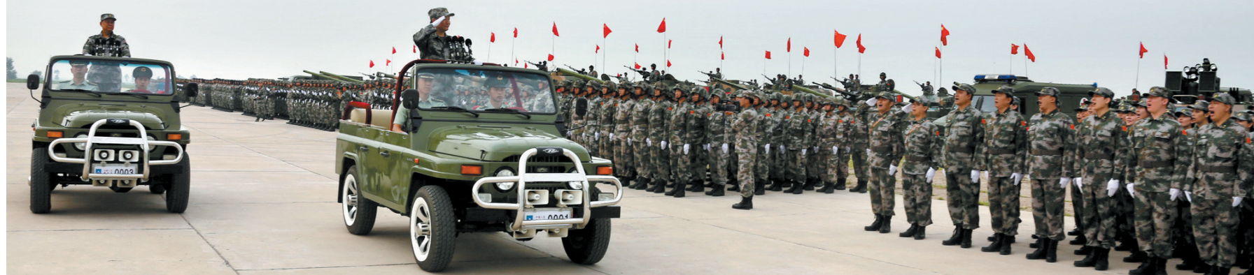
7月23日,在“和平使命—2013”中俄联合反恐军事演习誓师动员大会暨出发仪式上,沈阳战区首长检阅我军参演部队

据新华社沈阳7月27日电 根据中俄双方达成的共识,“和平使命—2013”中俄联合反恐军事演习从7月27日至8月15日在俄罗斯车里雅宾斯克举行。