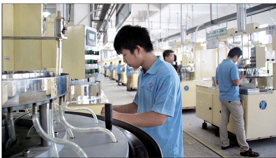
已经试生产的天成信隆光电触摸屏项目车间一隅

一是围绕铝精深加工做文章,持续推动煤电铝产业升级。下半年,该县要引导和支持龙鼎铝业充分发挥机制灵活的优势,更加注重科技创新,不断拉长产业链条。研究利用香