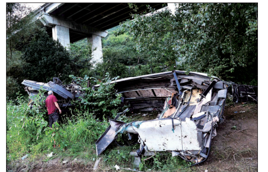
大巴残骸

据新华社罗马7月29日电 一辆载有48人的大巴28日晚在意大利南部那不勒斯附近冲出高速公路,目前已造成38人死亡。