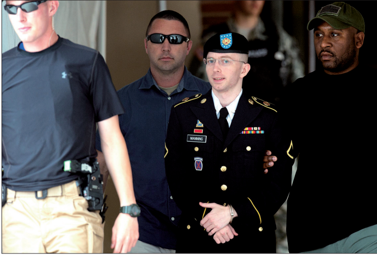
7月30日,在美国马里兰州米德堡军事基地,布拉德利·曼宁(右二)从军事法庭走出。

美国大兵、前驻伊拉克美军情报分析员布拉德利·曼宁7月30日在美国马里兰州米德堡军事基地内一个军事法庭被判间谍罪名成立,可能面临136年监禁。但法庭没有支持检方关于曼宁间接为“基地”组织提供帮助的指控。