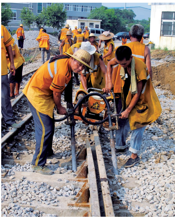
工人正在进行最后的施工