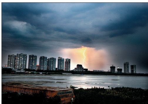
昨日傍晚,从洛阳桥向东望去,一道闪电划过乌云密布的天空

受副热带高压控制,刚刚过去的双休日,我市气温居高不下,高温橙色预警接连响起。面对酷热难耐的天气,不少市民吐槽:“坐着不动都大汗淋漓,今年真是热‘惹’了。”市气象台监测数据显示,10日、11日,我市不少地区最高气温再次突破37℃。