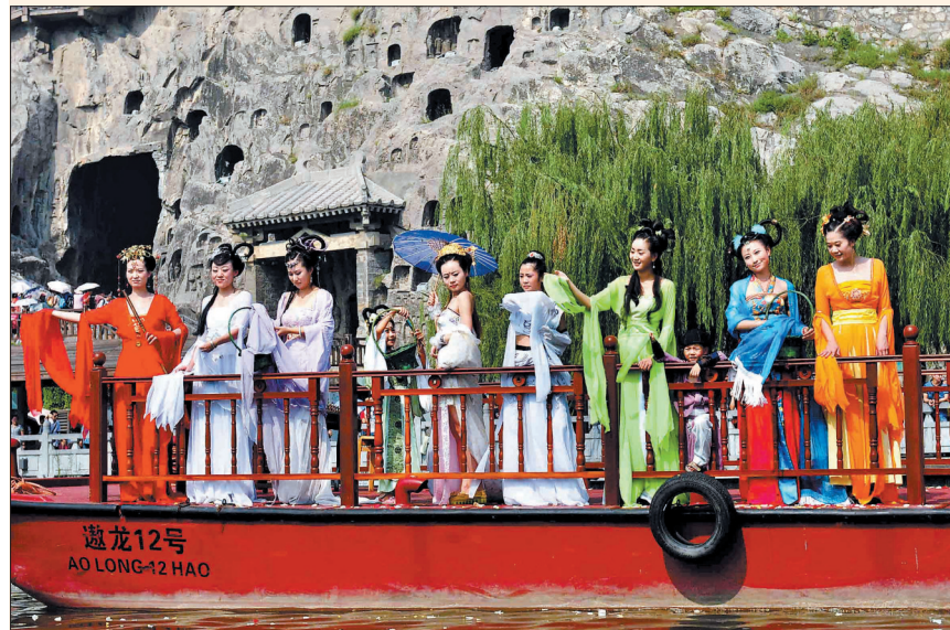
10日上午,身着红、黄、紫等7种颜色服装的“七仙女”亮相龙门石窟景区。七夕将至,龙门石窟景区举办“浪漫七夕,我的穿越梦”主题活动。“仙女”们泛舟伊河,在奉先寺、珍珠泉旁舞动身姿,并与中外游客互动。