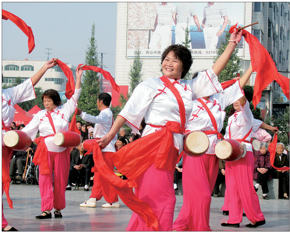
街心公园广场上人们欢快地打起腰鼓 (资料图片)

这是伊川县2013“全民健身 舞动中原”主题活动的启动仪式现场。广场上风格迥异、各显千秋的健身项目为民众带来了一场酣畅淋漓的视觉盛宴。