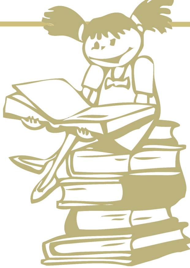
(本版图片均为资料图片)

“科普出版社也在策划推广‘青少年科普分级阅读活动’，合理的分级对于少儿科普图书比一般的少儿读物更重要。比如是否与各年级的认识水平相匹配？能否成为某个阶段教学的有益补充？国外的相关分级也是借鉴了脑科学的研究成果，而我国从理论到实践的转化还需要一个过程。”颜实说。