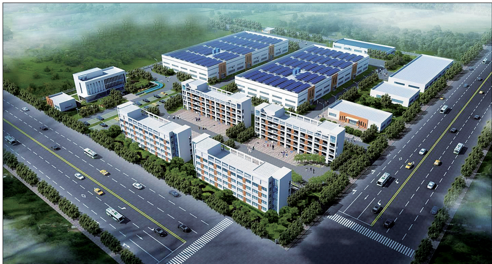
华阳产业集聚区新引进的项目效果图

孟津县自7月15日开展招商引资“百日会战”活动以来,全县上下紧急行动,四路出击,迅速掀起新一轮的招商引资浪潮,招商引资凸显“雁阵效应”。在短短20多天里,全县11个镇(区),32个重点、重要招商引资部门共外出招商35批85人,对接项目32个,在谈项目36个,签约项目12个。