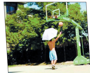
当然,也不能天天待在空调房间里,要适当运动,适量排汗