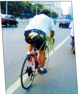
要多吃新鲜的绿色蔬菜,有助于防暑,补充营养成分