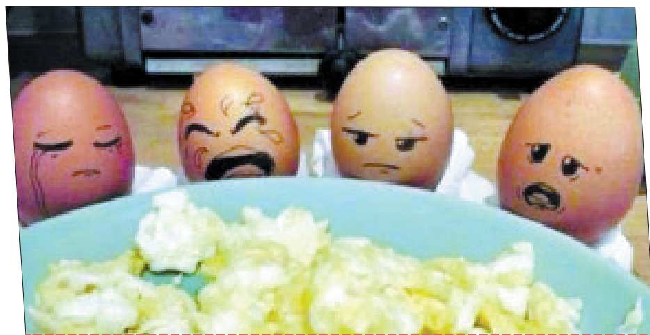
可怜的鸡蛋们,被人类多次用来进行烈日下的煎鸡蛋试验,非常悲惨