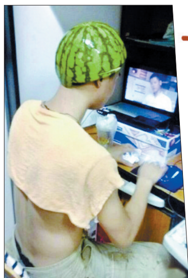
宿舍没空调,电风扇又不给力,我那机智的小伙伴灵机一动,自创了降温神器