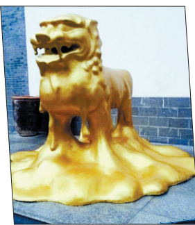
更夸张的是这头狮子,坚持站岗多天之后,它终于被晒化了