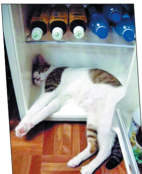
在这样的高温之下,人受不了,动物也受不了。我家的猫已经练就了开冰箱乘凉的绝招