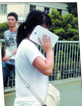
在炎炎烈日下,超大屏手机一举击败 iPhone5,成为遮阳避暑之必备

说起近期洛阳的天气……算了,还是不说了,因为说多了都是汗。在这“人和烤肉就差一撮孜然”的天气里,小编为大家搜集整理了一组高温天的搞笑图片,愿您在笑一笑的同时,暂时忘记现在有多热。