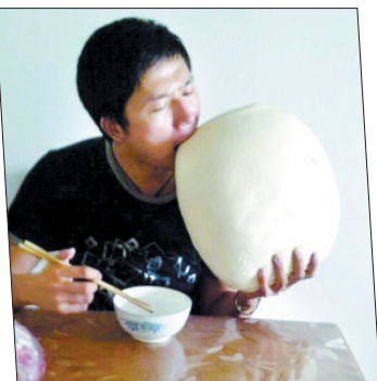
连续40℃以上的高温天,很多人都生病了,医生说,最好要吃得清淡一点