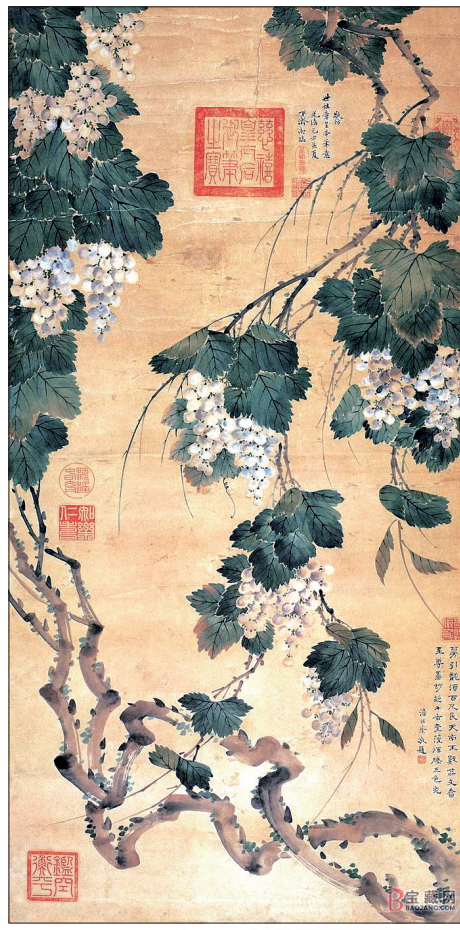
葡萄图 慈禧(清) (资料图片)

回到洛阳后,在庭院中种了一株葡萄,并写《葡萄歌》一诗:“野田生葡萄,缠绕一丈高。”