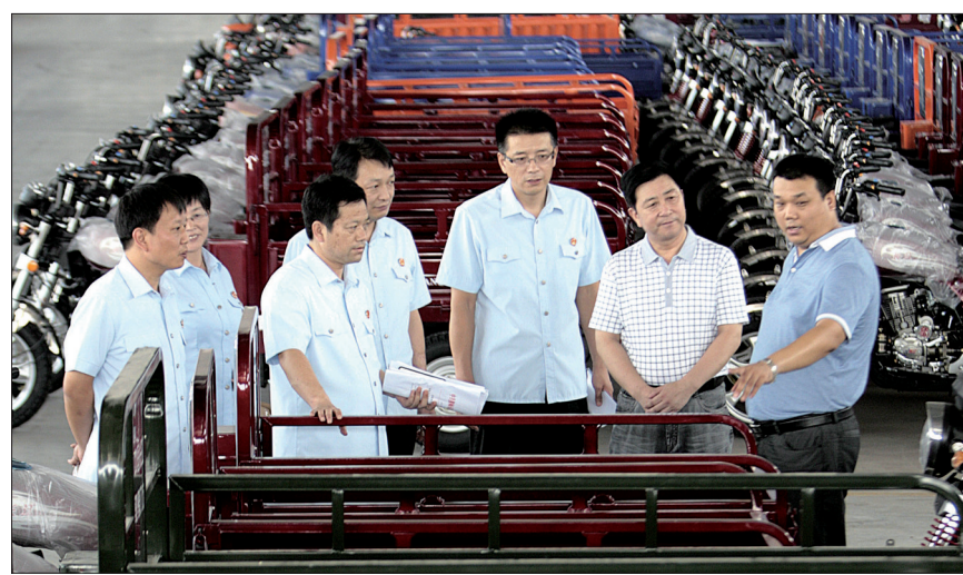
偃师市几名政法干警走进一家企业调研,帮助企业解决难题

上,调整产业布局,不让企业走弯路也是偃师服务企业的重要着力点。偃师招商引资新引进的项目,以是否有利于延伸现有企业的产业链,是否有利于转型升级和经济结构调整为目标,凡是不符合偃师产业发展的项目,一律不予考虑。比如偃师三轮摩托车产业发展目前已相对成熟,在招商中主要关注和引进转型升级项目,如“三轮”变“四轮”的微型卡车项目等。