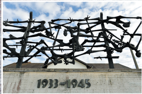
达豪纳粹集中营纪念馆竖立着南斯拉夫艺术家南多尔·格利德的雕塑作品