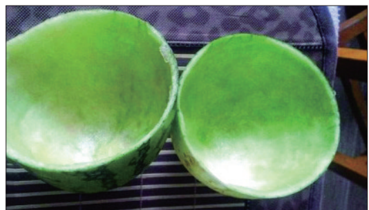
在刚刚过去的酷暑季节,我们被高温折磨得生不如死,西瓜也被我们折磨得生不如死