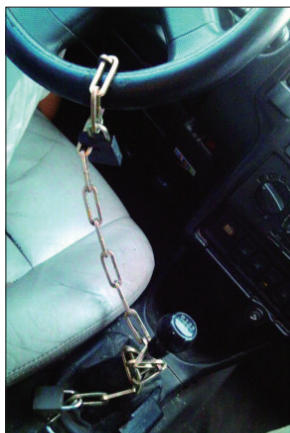
有的则抓紧时间学习新技能,比如学一学开车,同时也学习到了锁车的技能