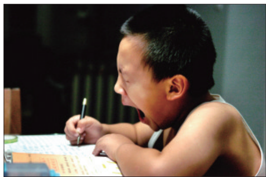
一转眼,暑假将尽。面对惨淡的开学之路,忍不住问一句:你的暑假作业做完了吗?

在很多人感叹酷暑终于要结束的同时,不少小伙伴却恨不得再过一遍夏天。为什么呢?因为暑假就要结束了。这个时候,有的同学开始恶补假期作业,有的同学开始为新学期做准备……不管怎么说,小伙伴们都不淡定了。