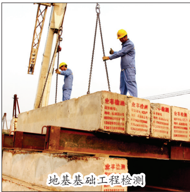
地基基础工程检测