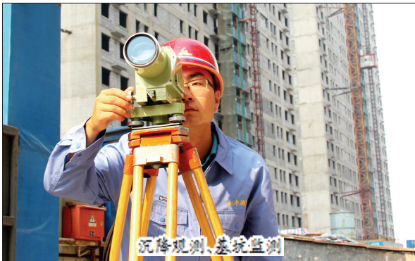
沉降观测、基坑监测