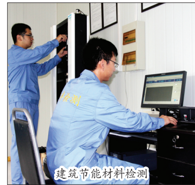
建筑节能材料检测