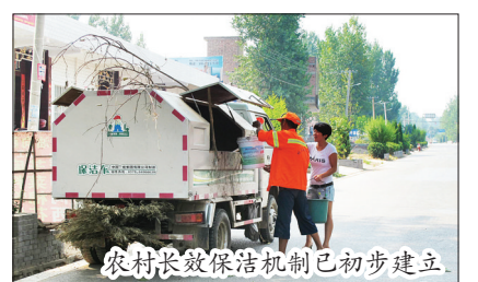
农村长效保洁机制已初步建立