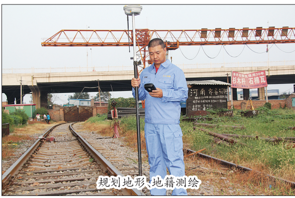
规划地形、地籍测绘