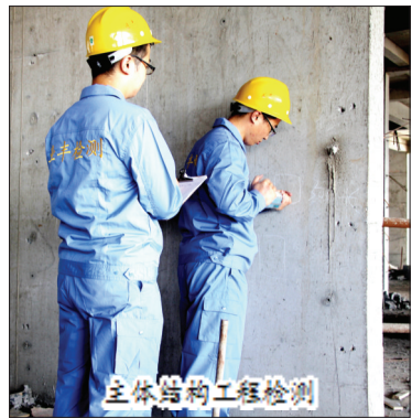
主体结构工程检测