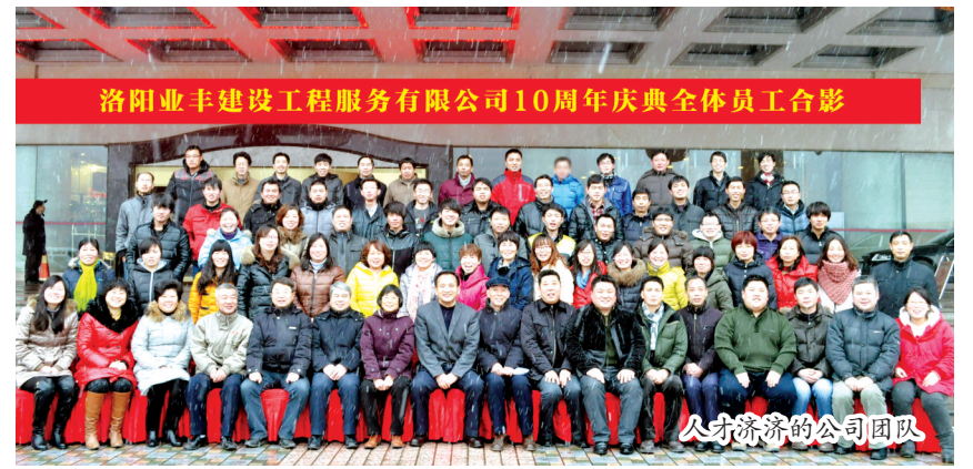
洛阳业丰建设工程服务有限公司10周年庆典全体员工合影

过去的10年,是业丰公司优化管理、提高素质的10年。早在2005年,为提高企业管理水平,公司在资金短缺、厂房条件差的情况下,克服重重困难推行现代企业管理制度,建立较为完善的质量保证体系,通过了ISO9001国际质量体系认证;加强企业内部管理,制定员工手册,形成了独具业丰公司特色的管理模式,基本实现了管理制度化、业务流程化、工作标准化,使企业逐步走上了“清晰、有序、和谐、高效”的良性发展轨道。