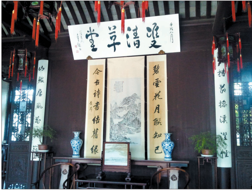
陈阁老宅双清草堂