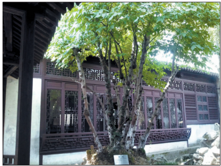
陈阁老宅内300多年树龄的腊梅

这位保洁员热情地挽留我们,说当天晚上可以看到这个月中最大的潮,但时间有限,只能心存遗憾,回想着这一段神奇的传说,猜想大潮来临时的壮观景象。